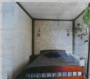
Päivällä katto on aivan valkea.

”Melkein kaikki haluavat Otavan ja aika moni oman horoskoopitähdistönsä.”